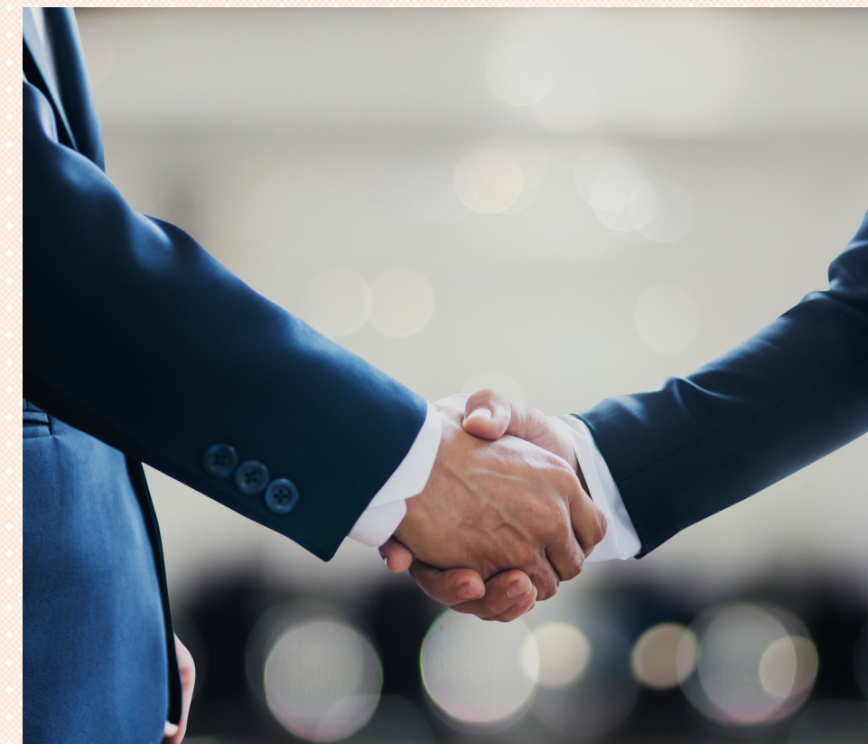
Профессиональная работа службы медиации