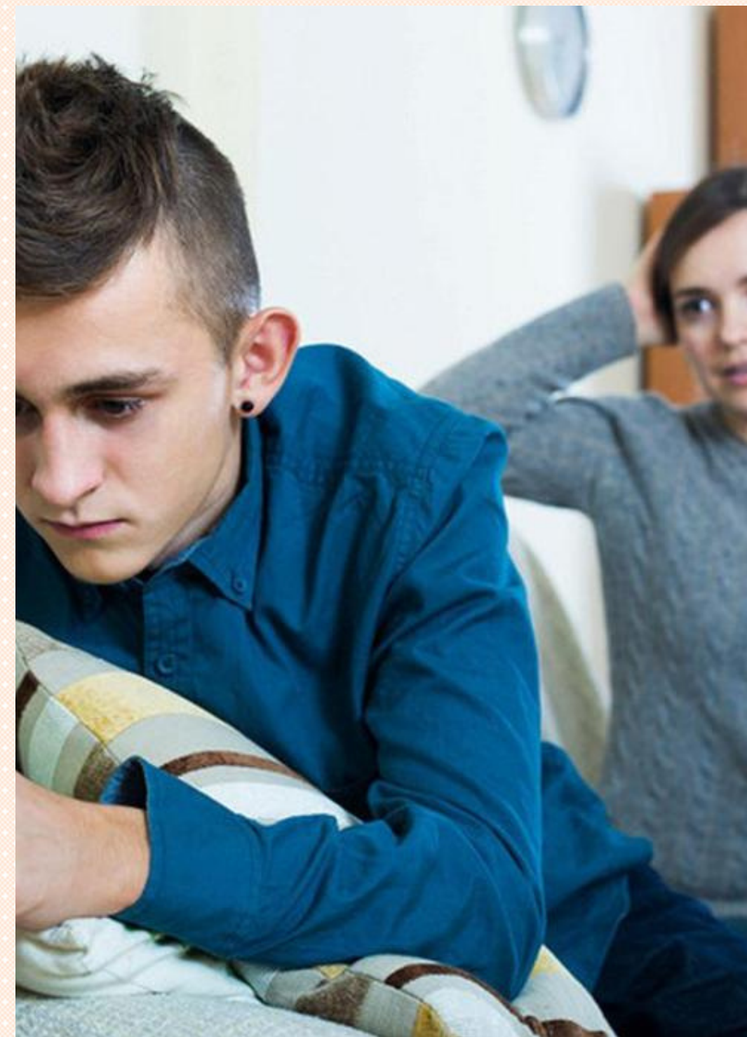
Между детьми и взрослыми